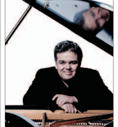
El pianista Arcadi Volodos