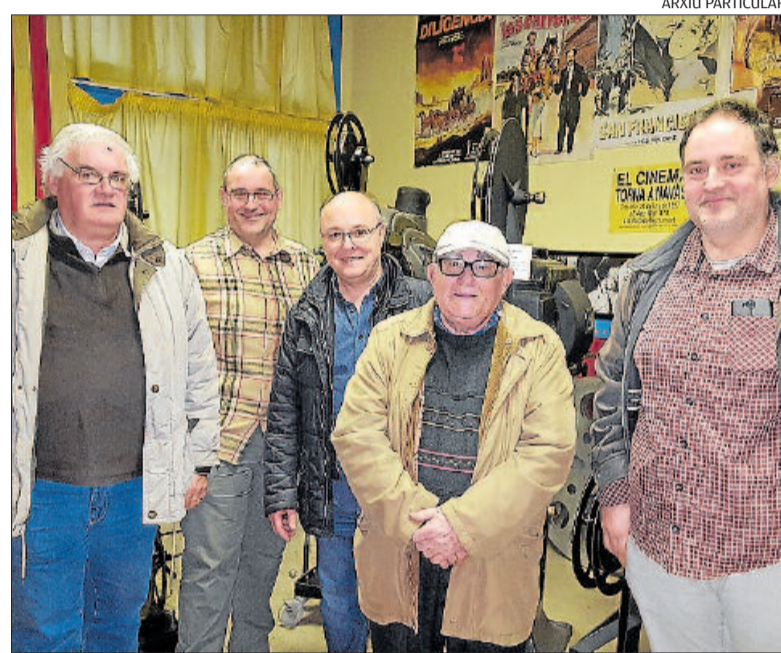
Promotors del Clam amb membres de l'Associació Cultural Foto Film Navàs

► L'ara Festival de Cinema Social de Catalunya arriba als 14 anys i se celebrarà del 27 d'abril al 7 de maig